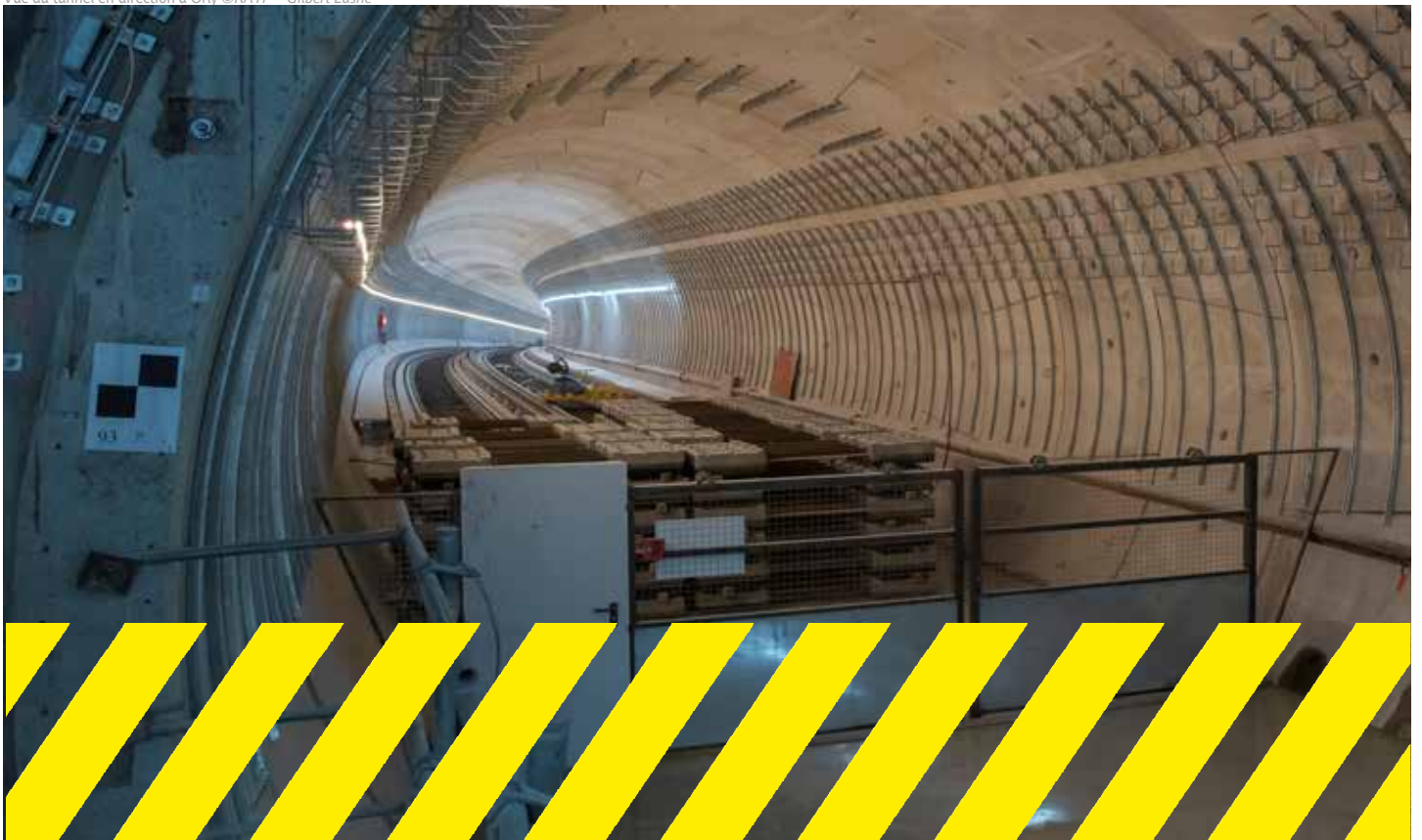
Vue du tunnel en direction d'Orly

Et pour retrouver le projet en ligne : la14plus14.fr