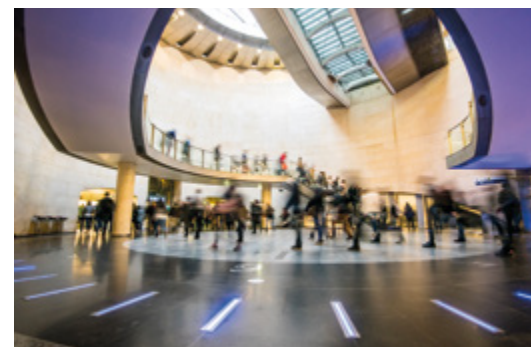
Projets architecturaux des gares M.I.N. Porte de Thiais, Pont de Rungis et Kremlin-Bicêtre Hôpital

Avec son prolongement au sud de 14 km d'ici 2024, suivant les prolongements au nord de 5,8 km jusqu'à Mairie de Saint-Ouen à l'été 2020, puis 1,6 km jusqu'à Saint-Denis Pleyel en 2023, la ligne 14 va devenir la plus longue du réseau existant. En correspondance avec les 4 autres lignes du Grand Paris Express et 80% des lignes de métro, tramway et RER existantes, elle sera à même d'accueillir jusqu'à 1 million de voyageurs par jour.